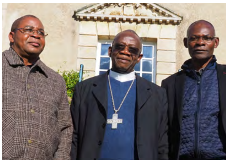
les prêtres de Mbuji-Mayi dans l'Orne et leur évêque (au centre).