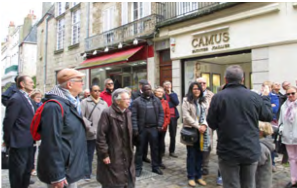
Devant la basilique.