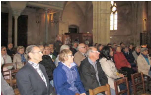
Dans la basilique.