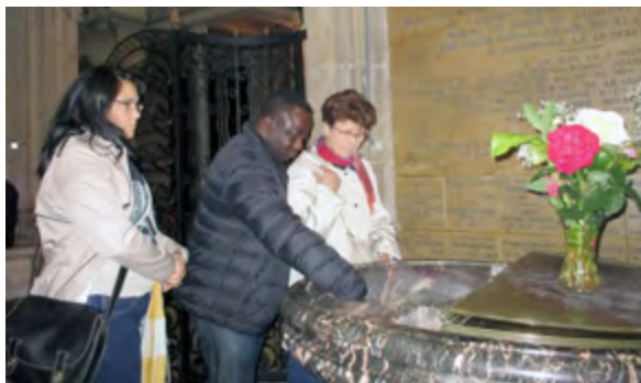
Chacun se signe au baptistère ou sainte Thérèse reçut le baptême.

Nos guides ont su accompagner notre marche par des anecdotes et des commentaires qui nous permirent de mieux comprendre la vie de cette famille pieuse mais sans austérité, vivant chrétienne-