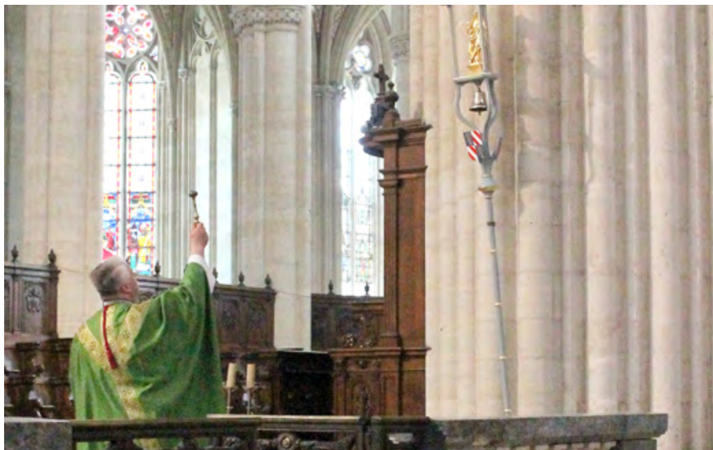
Le Père de Sainte Preuve bénissant le tintinnabulum.

Depuis 1871, la cathédrale de Sées a été érigée en basilique. Mais elle n'avait jamais reçu les insignes liés à cette charge. L'oubli est désormais réparé.