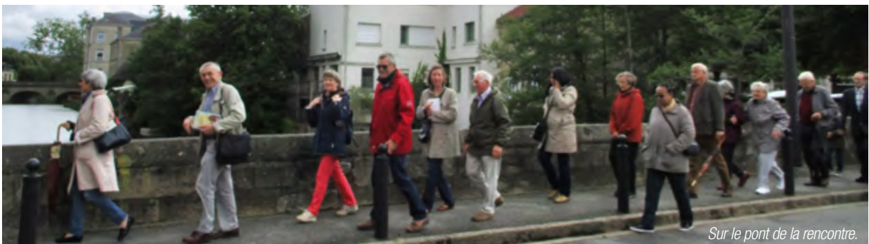
Sur le pont de la rencontre.