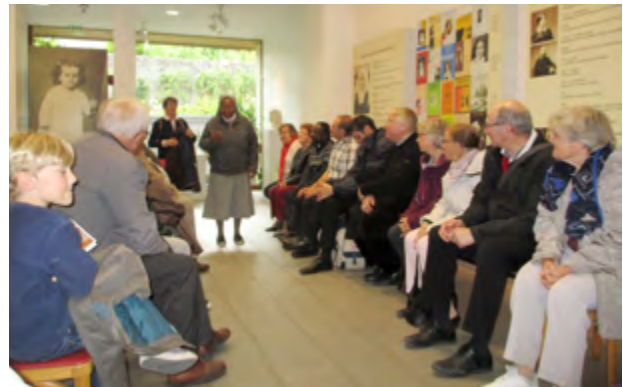
À la maison familiale.