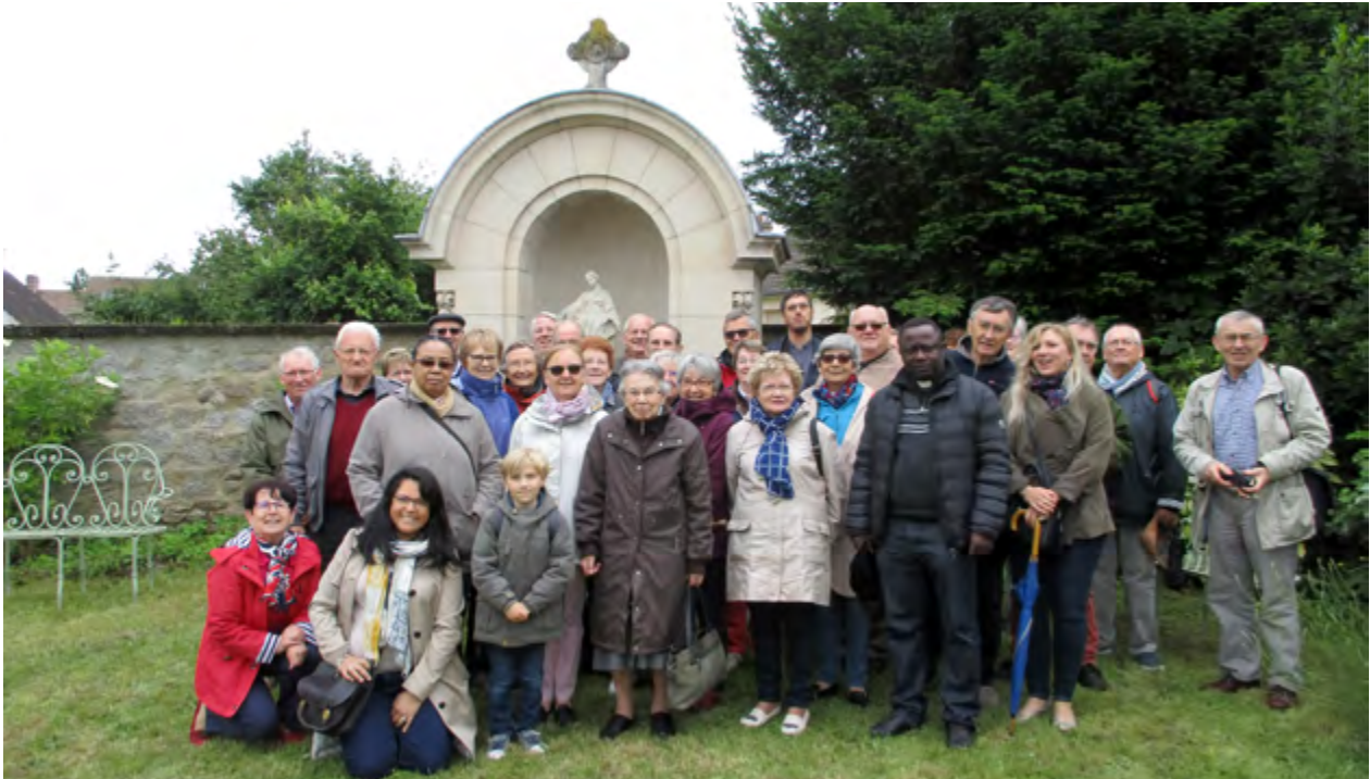
Le groupe au pavillon de Louis.