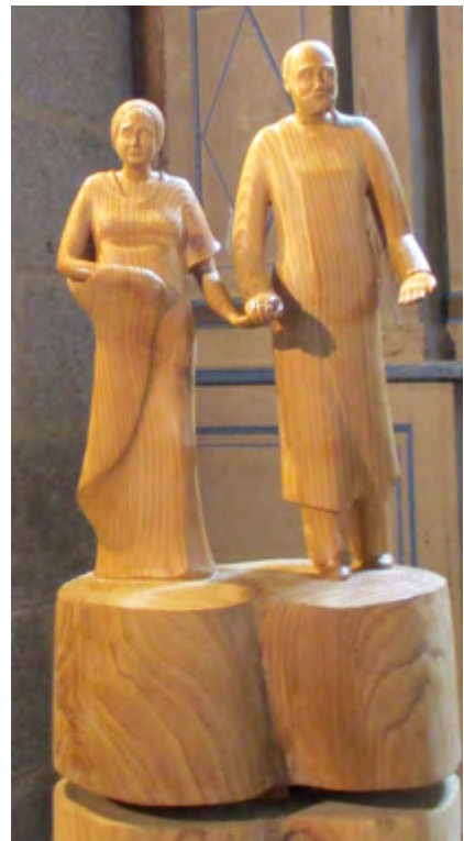
Sculpture de Louis et Zélie.

ment la vie d'un horloger et d'une dentellière de son temps. Saint Louis arrêta son activité d'horloger où il installa son compagnon, pour aider sainte Zélie dans son activité de dentellière, voyageant pour démarcher sa clientèle. À ces déplacements professionnels, ils surent ajouter des pèlerinages, à Lourdes, pour demander la guérison du cancer de sainte Zélie, puis à Rome où sainte Thérèse eut l'audace de demander au pape la permission d'entrer au carmel à quinze ans. Saint Louis était membre du cercle de réflexions Ozanam, où avec d'autres Alençonnais, il réfléchit sur un catholicisme social.