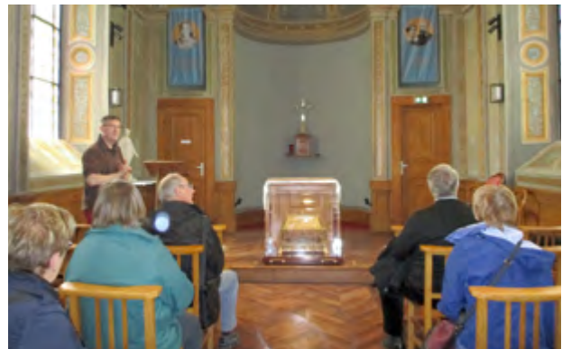
La chapelle de la Maison d'accueil Louis et Zélie.